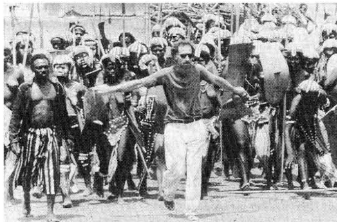
Billige Statisten – aber sehr selbstbewusst: Regisseur Werner Herzog mit Ghanesen bei den Dreharbeiten